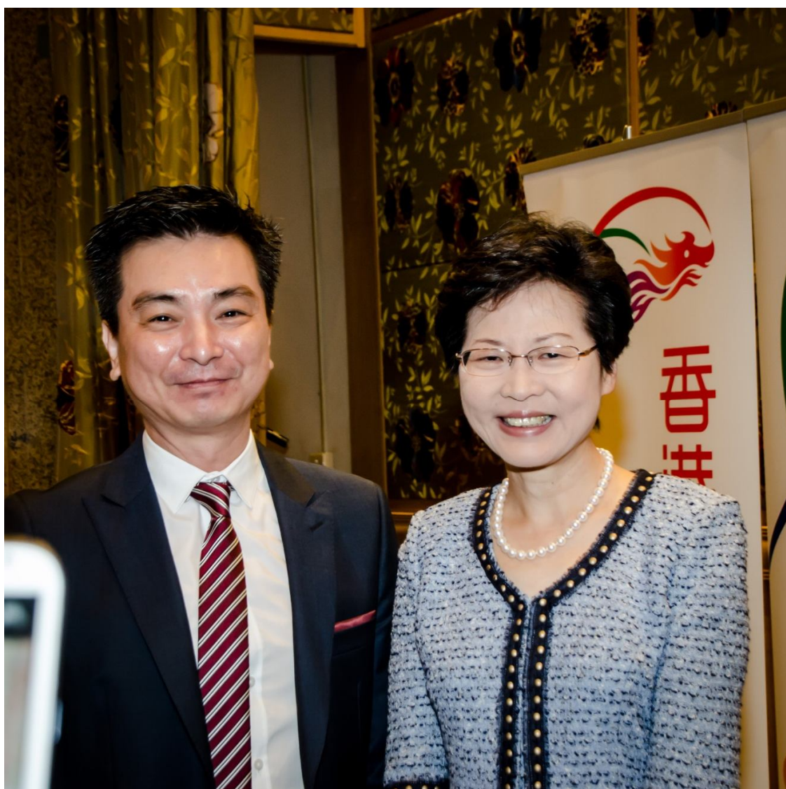
泰國香港商會會長余永年率在泰國港人迎接香港政務司司長林鄭月娥合影